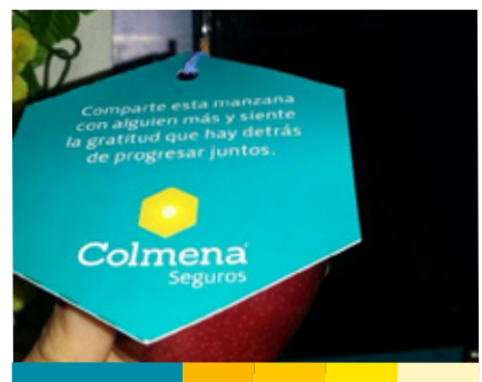
Activación Colmena Seguros - XXVI Convención Internacional de Seguros, Cartagena 2015.