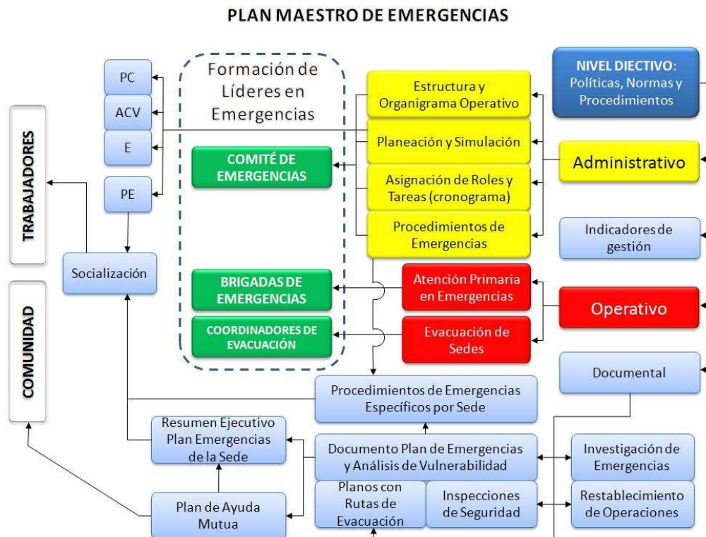
Grafico N°1: Macro procesos para la estructuración y administración en la atención de emergencias en las organizaciones.